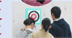
何点かな？只今審査中...