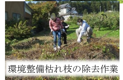
環境整備枯れ枝の除去作業