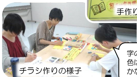
チラシ作りの様子

8月28日に行なわれる市民フェスタのいちサポブースに張り出すチラシ、展示パネルなどを参加者がアイデアを出し合って作成しています。