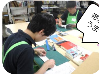
新刊の検品と本の帯加工の様子