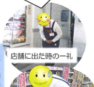
店舗に出た時の一礼

体験内容 店内ルールを学ぶ、挨拶訓練、商品の前出し作業、バックヤード・店内見学、従業員のお話