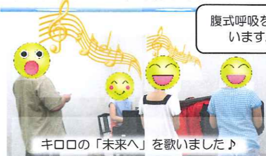
キロロの「未来へ」を歌いました♪