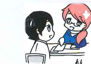
イラスト：一関修紅高等学校 美術・イラスト同好会 K.Kさん