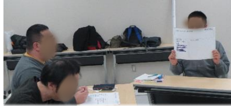
「5年後 なっていたい自分」について発表!