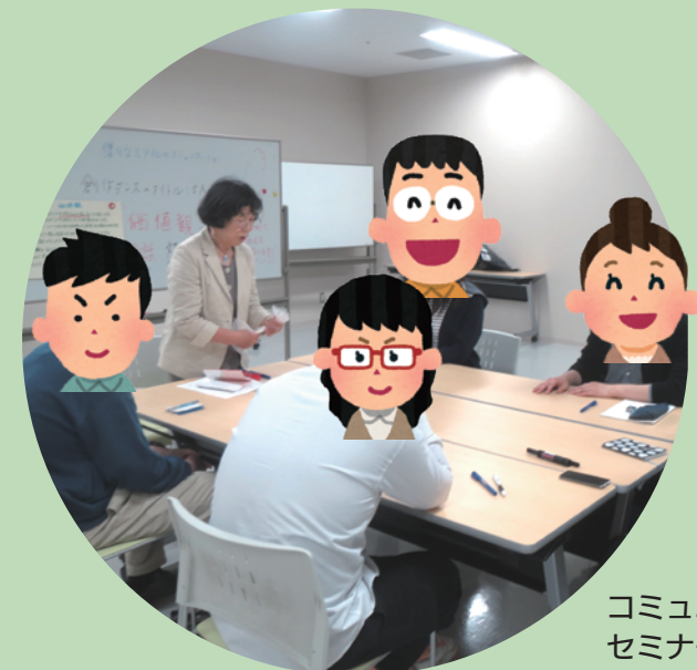
コミュニケーション セミナーの様子