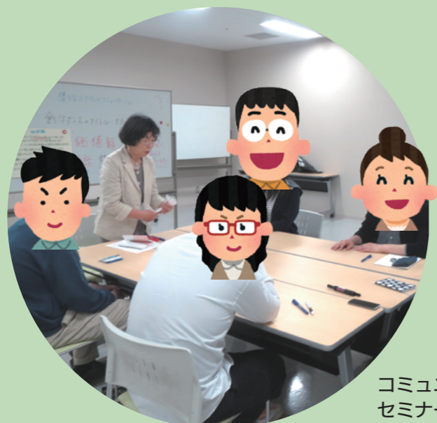
コミュニケーション セミナーの様子