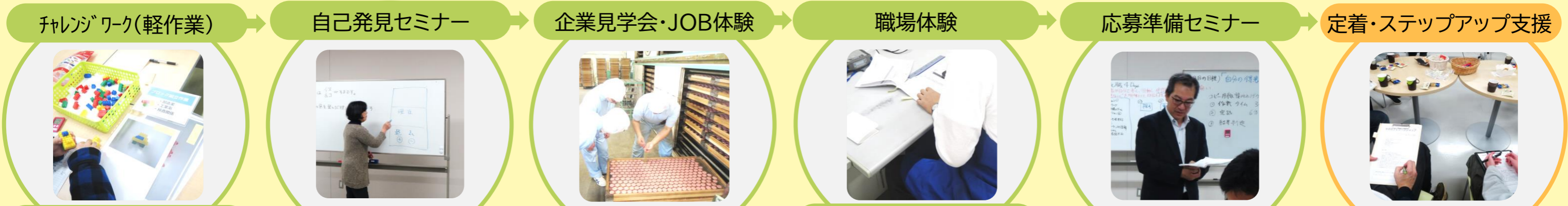
軽作業体験(ブロックの組み立て) 等 コミュニケーションセミナー 等 例:株式会社水沢米菓でのJOB体験 例:株式会社サンデーでの職場体験 4DAYSセミナーでの応募準備 等 サポカフェワークショップでの活動 等

「何からはじめたらいいかわからない」という人が、最初の一步を踏み出すためのプログラム。 いちサポ事務所の隣室で行う総菜容器等の仕分けや、ネジ・ナットの部品組み立て、分解作業等の体験をするチャレンジワークには、多くの方が参加しています。 軽作業の体験を通して、働くために必要とされる様々なスキルを身につけます。