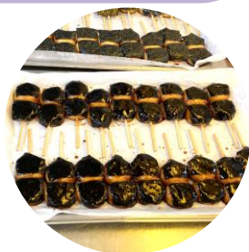
揚げ餅(写真) 大変美味しそうでした！

一関市ふるさと納税の返礼品に指定されている商品も作っている為、全国に発送している。当日は揚げ餅づくりの見学後、団子の串差し作業を見学。1本の竹串に4個の団子を刺していく。1cm弱の厚さの団子の中芯を見事な手捌きで刺していた。見学者は団子刺しの手早さに感心しきりでした。「分からない事があったら遠慮なく聞くことが大事」とのアドバイスも頂きました。